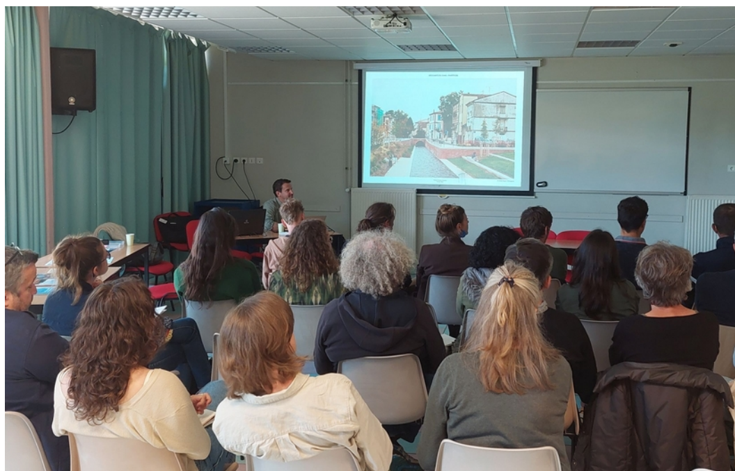
Présentations en salle du matin