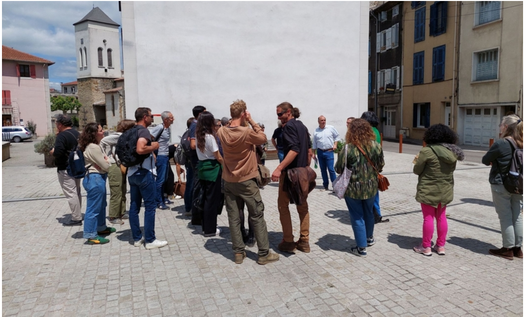
Explication du projet et des démarches engagées

L'après-midi s'est déroulé sur la commune de Lavelanet et a consisté à découvrir l'aménagement de redécouverte d'une section de la rivière Pipié, dans le quartier de Secoustous. Cet aménagement constitue une illustration des ambitions développées dans le cadre d'un programme plus large « Lavelanet 2050 ». Les aménagements ont bénéficié d'un financement au titre du programme TEPCV.