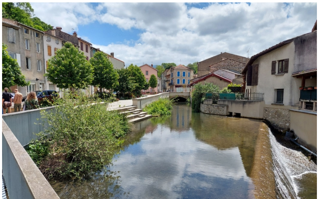
La rivière retrouvée et un nouvel espace public végétalisé et ensoleillé