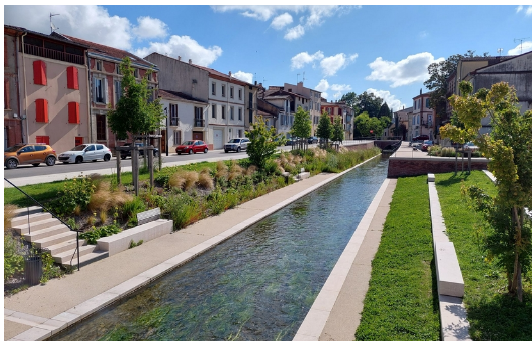
L'aménagement paysager autour du canal de Pamiers